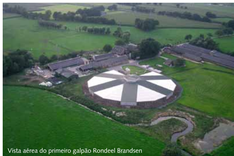
Vista aérea do primeiro galpão Rondeel Brandsen

Além da Universidade, vários outros parceiros foram envolvidos no projeto, entre os quais destaca-se a organização de proteção dos direitos dos animais nos Países Baixos. Além disso, o grupo Venco (Vencomatic, Prinzen, Agro Supply) desempenhou um papel importante na equipe de pesquisa. Finalmente, em 2008, o conceito Rondeel nasceu após anos de esforços de intensiva investigação. A empresa Rondeel bv, um novo membro do grupo Venco, tomou a iniciativa de construir o primeiro galpão Rondeel e, no início deste ano, tornou o conceito uma realidade. Uma nova era havia começado no alojamento de aves poedeiras.